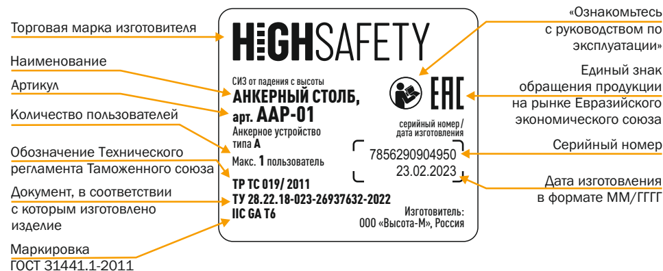
Рис. 2 Маркировка.

Маркировка размещена на трудноудаляемой этикетке (рис. 2) в соответствии с ТР ТС 019/2011 и ГОСТ Р ЕН 365-2010 и содержит следующие характеристики: